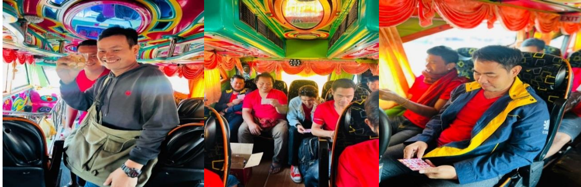
รถบัสวีไอพีปรับอากาศ 2 ชั้น