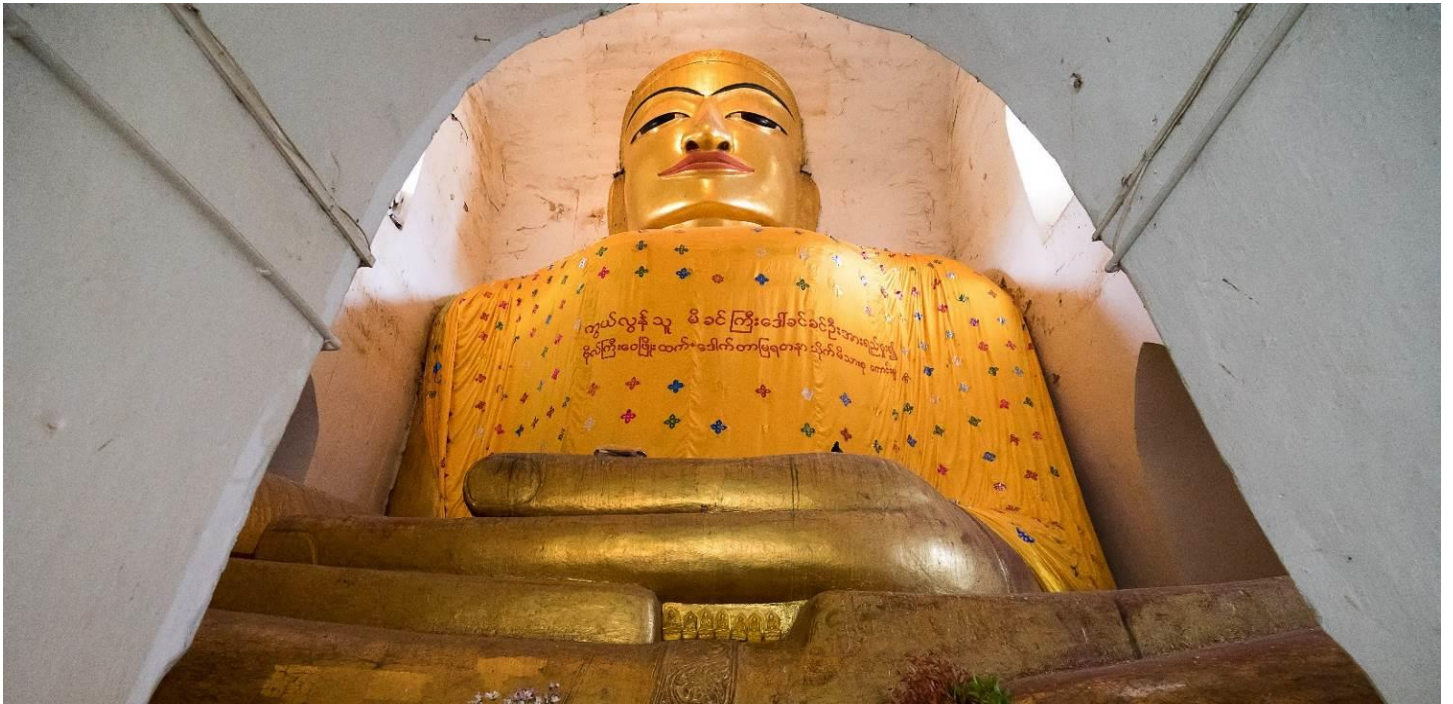
จากนั้นนำท่านชม วัดกุบยางก์ สร้างโดยพระโอรสของพระเจ้าจันสีหะ สิ่งที่น่าสนใจคือภาพจิตรกรรมบนฝาผนังอย่างสวยงาม เรียกได้ว่าสวยที่สุดในพุกามก็ว่าได้