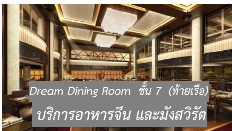
Dream Dining Room ชั้น 7 (ท้ายเรือ) บริการอาหารจีน และมังสวิรัต