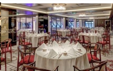
Genting Dining upperชั้น 8 (ท้ายเรือ) บริการอาหารจีน