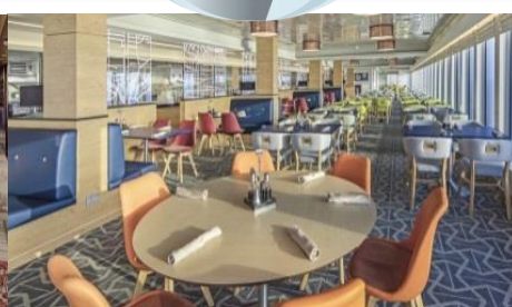
The Lido ชั้น 16 (ท้ายเรือ) บริการอาหารบุฟเฟต์นานาชาติ

หมายเหตุ ทุกท่านสามารถเลือกซื้อแพ็คเกจเครื่องดื่มได้ ในระหว่างที่อยู่บนเรือ สำราญตลอดการเดินทาง เพียงใช้ CRUISE CARD ในการสั่งซื้อ รายละเอียดของแพ็คเกจสามารถขอได้จากเจ้าหน้าที่บนเรือสำราญ