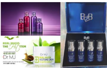
ครีมหน้าแตก , BB Cream , etc

โดยพระอาจารย์ Naong เมื่อปี 1376 ในช่วงรัชสมัยของกษัตริย์ Uwang แห่งราชวงศ์ Goryeo จากนั้นในปี 1970 ได้มีการบูรณะด้วยความพิถีพิถันเพื่อให้คงไว้ซึ่งเอกลักษณ์และความงดงามแบบดั้งเดิม จากประตูซุ้มมังกรสีทองอร่าม ลอดผ่านอุโมงค์ขนาดเล็ก ไปสู่ทางเดินบันไดหิน 108 ขั้น เป็นจุดชมวิวดูความงดงามของทะเล บริเวณวัดประดิษฐานพระพุทธรูปศักดิ์สิทธิ์องค์สำคัญ ตั้งตระหง่านอยู่บนโขดหิน ทางเดินเป็นสะพานที่ทอดยาวเข้าสู่บริเวณตัววัด ประกอบด้วยวิหารและศาลาเรียงรายลดหลั่นกันไปตามโขดหิน โดยบริเวณด้านหน้าของวิหารหลัก มีเจดีย์สูง 3 ชั้น และสิงโต 4 ตัว เป็นสัญลักษณ์ของความสนุก, ความโกรธ, ความเศร้า และความสุข นอกจากนี้ ภายในวัดประดิษฐานเจ้าแม่กวนอิม, พระสังกัจจายน์องค์สำคัญของอร่าม, ศาลาราย วัดแห่งนี้เป็นที่ตั้งศิลปะที่หมู่บ้านคูเมืองของชนปูซาน เป็นสถานที่ที่เหล่าพุทธศาสนิกชนเกาหลี