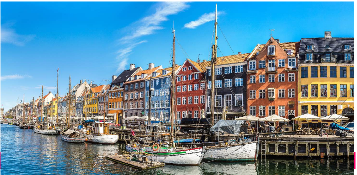
อิสระท่องเที่ยว หรือ พักผ่อน ที่เมืองโคเปนเฮเกน ตามอัธยาศัย แบบเดิมน (ไม่มีบริการรถโค้ช)

☛ นำคณะเข้าสู่ที่พัก Hotel Osterport , Copenhagen , Denmark หรือเทียบเท่า