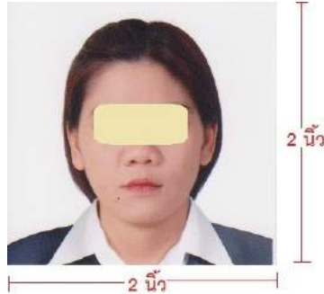
รูปถ่ายยื่นวีซ่า ต้องเห็นสัดส่วนใบหน้า เกิน 50%

หนังสือเดินทางของท่าน จะถูกส่งคืนมาที่บ้านท่านทางไปรษณีย์ ตามที่อยู่ที่คุณกรอกในแบบฟอร์มไว้