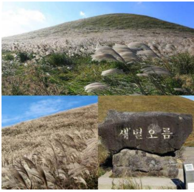
งานเทศกาล)

พาทุกท่านเดินทางสู่ ทุ่งดอกหญ้า แซ พยอล โอริม เป็นภูเขาไฟที่มีชื่อเสียงอีกแห่งหนึ่งของเกาะเชจู เป็นสถานที่มองเห็นดาวประจำเมืองที่เปล่งประกายสวยงามบนท้องฟ้ายามพลบค่ำและเป็นรู้จักกันอย่างแพร่หลายในรายการชื่อดังอย่าง Hyori's Home Stay ทุกท่านสามารถขึ้นมาสัมผัสบรรยากาศอันสดใสนุ่มพระอาทิตย์กับบนภูเขาไฟแห่งนี้ ขอแนะนำว่าห้ามพลาดเด็ดขาดๆ นอกจากนี้สถานที่แห่งนี้เป็นที่จัดเทศกาล Jeju Fire Festival จะมีขึ้นที่บริเวณเนินเขา โดยจะจัดในช่วงประมาณปลายเดือนกุมภาพันธ์ไปจนถึงต้นเดือนมีนาคมของทุกปี ที่นี่จะมีการจุดไฟอย่างยิ่งใหญ่ เพื่อเป็นการต้อนรับฤดูใบไม้ร่วงและยังเป็นการอวยพรให้มีสุขภาพดีอีกด้วย เพื่อทำการเตรียมพื้นที่ในการปลูกพืชสำหรับฤดูใบไม้ร่วงต่อไป (หมายเหตุไม่ได้พาไปชม