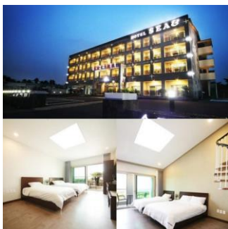
นำเข้าพักที่ Sea & Hotel หรือเทียบเท่า

พร้อมเสิร์ฟด้วยเมนู ซัมกย็อบซัล เป็นอาหารที่เป็นที่นิยมของชาวเกาหลี โดยการนำหมูสามชั้นไปย่างบนแผ่นโลหะที่ถูกเผาจนร้อน ซัมกย็อบซัลจะเสิร์ฟพร้อมกับเครื่องเคียงต่างๆ ได้แก่ กิมจิ พริกเขียว กระเทียมหั่นบางๆ พริกไทยป่น เกลือ และน้ำมันงา ถึงแม้ว่าซัมกย็อบซัลจะมีการเตรียมการที่สุดแสนจะธรรมดา คือไม่ได้มีการหมักหรือมีส่วนผสมที่หลากหลาย แต่ว่าถ้าพูดถึงรสชาติแล้วนับว่าพลาดไม่ได้เลย