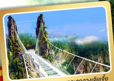
สะพานกระจกจางเจียเจีย

ฉางซา อุทยานจางเจียเจีย เมืองโบราณฟ่งหวง (นั่งรถไฟความเร็วสูง)