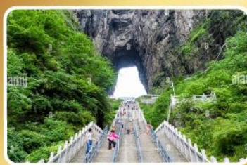
ประตูสวรรค์ เทียนเหมินซาน