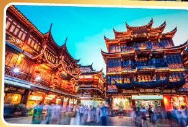
ตลาดร้อยปีเจิ้งหวิงเมี่ยว