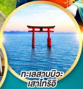
ทะเลสาบบิวะ เสาโทริอิ

เส้นทางสายอัลไพน์ทากายามา กำแพงหิมะ เขื่อนคุโรเบะ