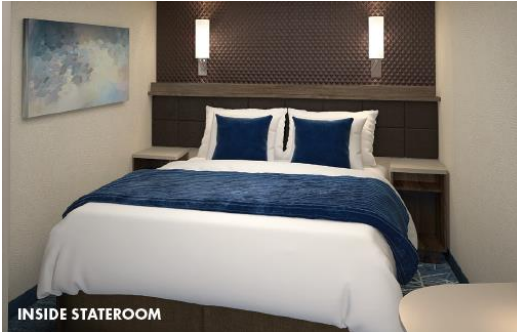
ห้องพักแบบไม่มีหน้าต่าง(Inside cabin) : ขนาด 135sq.ft