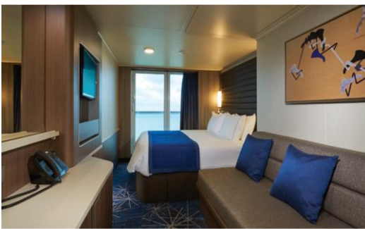
ห้องพักแบบมีระเบียง (Balcony cabin) : ขนาด 213 sq.ft (รวมความกว้างของระเบียง)