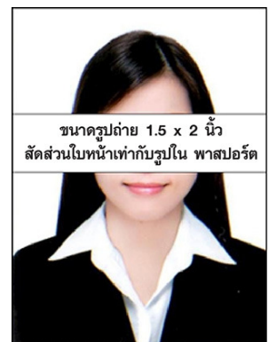
ขนาดรูปถ่าย 1.5 x 2 นิ้ว สัดส่วนใบหน้าเท่ากับรูปใน พาสปอร์ต