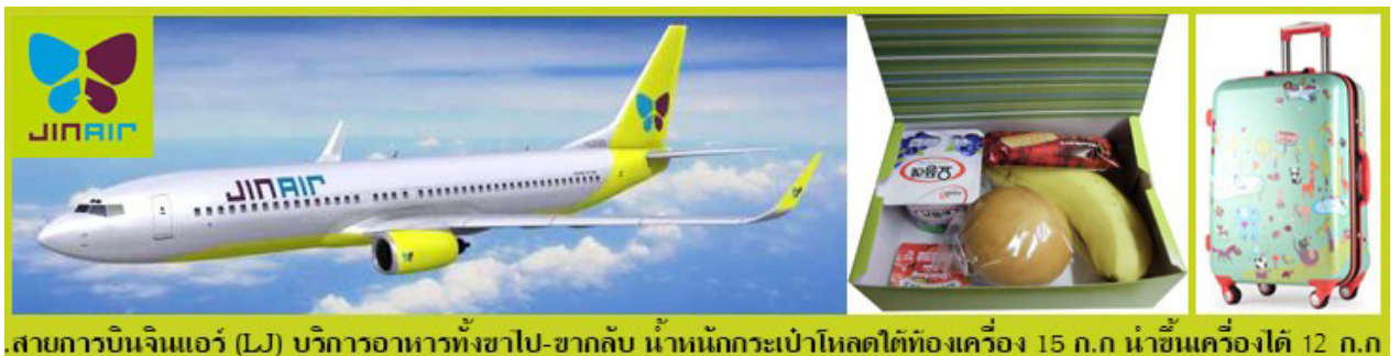
สายการบินจินแอร์ (LJ) บริการอาหารทั้งขาไป-ขากลับ น้ำหนักกระเป๋าโหลดใต้ท้องเครื่อง 15 กก. นำขึ้นเครื่องได้ 12 กก.

หมายเหตุ : เคาน์เตอร์เช็คอินเปิดบริการก่อนเวลาเครื่องออกอย่างน้อย 60 นาที ผู้โดยสารพร้อม ณ ประตูขึ้นเครื่องก่อนเวลาเครื่องออก 30 นาที