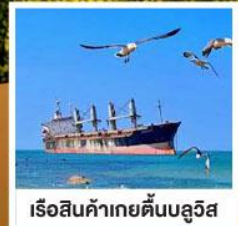
เรือสินค้าเกย์ตันบลูอิส