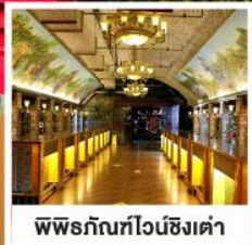
พิพิธภัณฑ์ไวน์ชิงเต่า