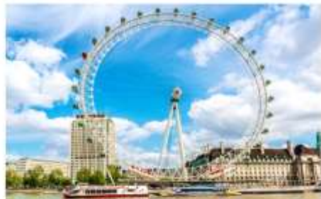
ลอนดอนอาย