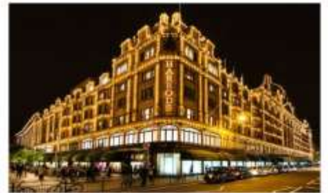
ห้างแฮร์รอดส์