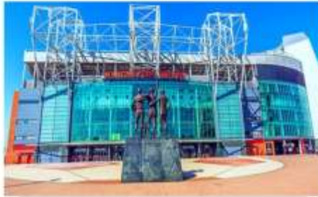
แมนเชสเตอร์