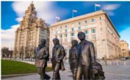
ลิเวอร์พูล