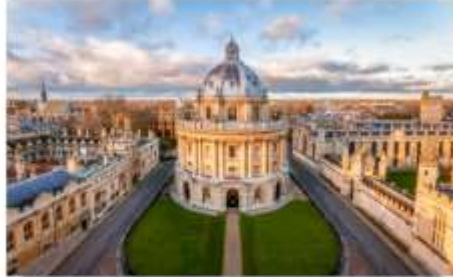
อ็อกฟอร์ด