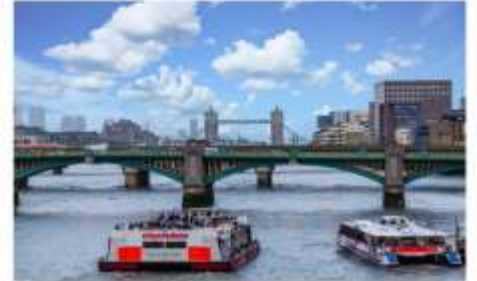
ล่องเรือแม่น้ำเทมส์