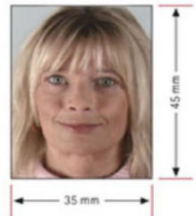
รูปถ่ายมาตรฐาน

2. รูปถ่าย รูปถ่ายสี หน้าตรงขนาด 35 มม. x 45 มม. ใบหน้า 90 เปอร์เซ็นต์ของพื้นที่รูปถ่าย จำนวน 2 ใบ ห้ามตกแต่งรูป ถ่ายจากร้านถ่ายรูปเท่านั้น ห้ามสวมแว่นตา หรือเครื่องประดับ , ต้องไม่เป็นรูปสติ๊กเกอร์ **แนะนำให้ลูกค้าไปถ่ายในสถานทูต 180 บาท จำนวน 4 รูปนะคะ หากจำเป็น**