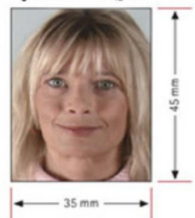
รูปถ่ายมาตรฐาน

2. รูปถ่าย รูปถ่ายสี หน้าตรงขนาด 35มม.x 45มม. ใบหน้า 90 เปอร์เซ็นต์ของพื้นที่รูปถ่าย จำนวน 2 ใบ ห้ามตกแต่งรูป ถ่ายจากร้านถ่ายรูปเท่านั้น ห้ามสวมแว่นตา หรือเครื่องประดับ , ต้องไม่เป็นรูปสติ๊กเกอร์ **แนะนำให้ลูกค้าไปถ่ายในสถานทูต 180 บาท จำนวน 4 รูปนะคะ หากจำเป็น**