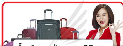
น้ำหนักกระเป๋าสูงสุด 20 ก.ก.