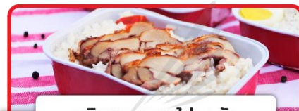
บริการอาหารไป-กลับ