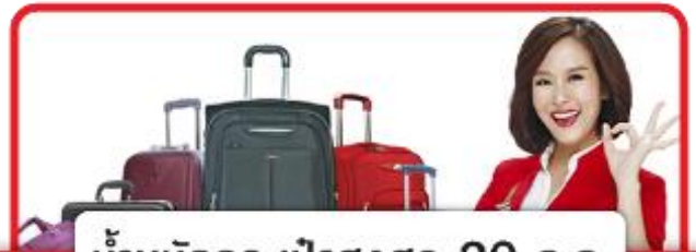
น้ำหนักกระเป๋าสูงสุด 20 ก.ก.

21.05 น. บินลัดฟ้าสู่ สาธารณรัฐเกาหลีใต้ โดยเที่ยวบินที่ XJ704 (ไม่มีบริการอาหารบนเครื่อง)