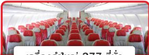
เครื่องลำใหญ่ 377 ที่นั่ง

18.00 น. คณะพร้อมกันที่ สนามบินนานาชาติดอนเมือง อาคาร 1 ชั้น 3 ประตู 4 เคาน์เตอร์ 4 สายการบิน AIR ASIA X เจ้าหน้าที่ของบริษัทฯ คอยให้การต้อนรับ และอำนวยความสะดวกในการขึ้นเครื่อง (หัวหน้าทัวร์แนะนำการเดินทาง) สายการบิน AIR ASIA X ใช้เครื่อง AIRBUS A330-300 จำนวน 377 ที่นั่ง จัดที่นั่งแบบ 3-3-3 น้าหนักกระเป๋า 20 กก./ท่าน (หากต้องการซื้อน้ำหนักเพิ่ม ต้องเสียค่าใช้จ่าย) **หมายเหตุ** เคาน์เตอร์เช็คอินจะปิดบริการก่อนเวลาเครื่องออกอย่างน้อย 60 นาที และผู้โดยสารพร้อม ฤ ประดูขึ้นเครื่องก่อนเวลาเครื่องออก 40 นาที (**ขอสงวนสิทธิ์ในการเลือกที่นั่งบนเครื่อง เนื่องจากต้องเป็นไปตามระบบของสายการบิน**)