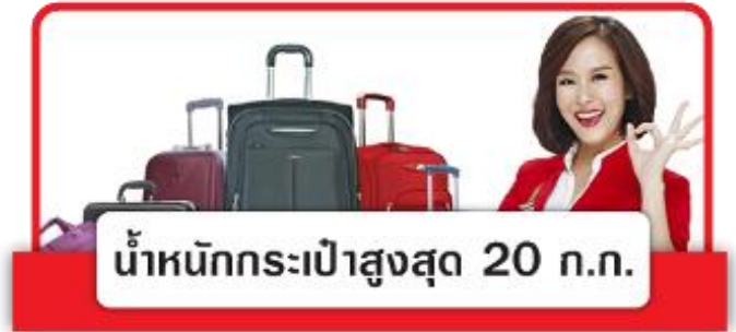
น้ำหนักกระเป๋าสูงสุด 20 กก.

16.00 น. บินลัดฟ้าสู่ สาธารณรัฐเกาหลีใต้ โดยเที่ยวบินที่ XJ702 (ไม่มีบริการอาหารบนเครื่อง) 23.35 น. เดินทางถึง สนามบินนานาชาติอินซอน (เวลาท้องถิ่นเร็วกว่าไทย 2 ชม. กรุณาปรับนาฬิกาของท่านเป็นเวลาท้องถิ่นเพื่อสะดวกในการนัดหมาย) หลังจากผ่านพิธีการตรวจคนเข้าเมืองและศุลกากรแล้ว ขอต้อนรับทุกท่านสู่สาธารณรัฐเกาหลีใต้ รถโค้ชนำทุกท่านข้ามทะเลตะวันตกด้วยสะพานแขวนยONGJONG หรือ สะพานเพื่อความหวังในการรวมชาติที่ยาวกว่า 4.42กม. และมียอดโดมสูง 107 เมตร นำท่านเดินทางสู่ เมืองอินซอน