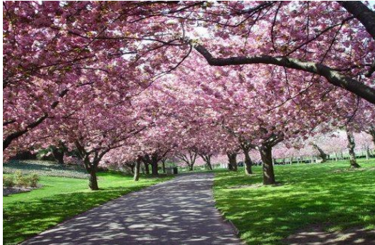
เปลี่ยนแปลงได้ขึ้นอยู่กับ

(โดยปกติซากุระจะบานช่วงประมาณปลายเดือนมีนาคมถึงต้นเดือนเมษายน อาจมีการ