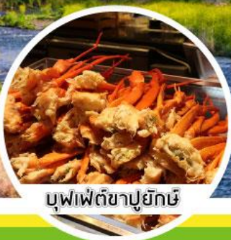
บุฟเฟ่ต์ซาปูยึกษ์

11 / 12 / 13 / 14 / 15 มี.ค.62 16 / 17 / 18 / 19 / 20 มี.ค.62 21 / 22 / 23 / 24 / 25 มี.ค.62 26 / 27 / 28 / 29 / 30 / 31 มี.ค.62 1 / 2 / 3 / 4 เม.ย.62