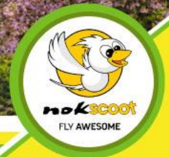
nok scoot FLY AWESOME

ชมดอกซากุระตามฤดูกาล แชน้ำแร่ออนเซ็น วัดอาซากุสะ ฝึกญี่ปุ่น