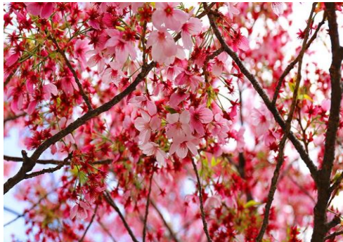
สภาพอากาศ)