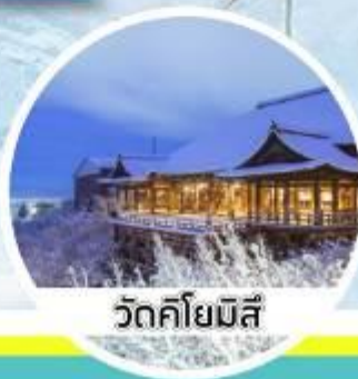
วัดคิโยมิสึ