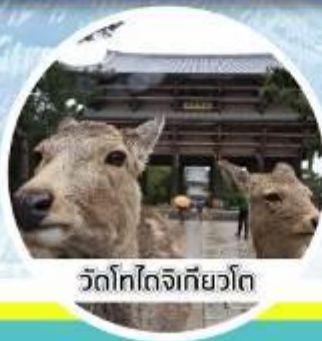
วัดโทไดจิเกียวโต