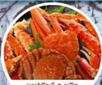
ชาปูยักซ์ 3 ชนิด