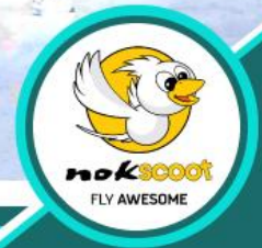
ลุ้นรับรางวัลทองคำ

โปรแกรมนี้เหมาะกับท่านที่ชอบเที่ยวอิสระ เรารวม ตั๋ว+ที่พัก+รถรับส่งสนามบิน