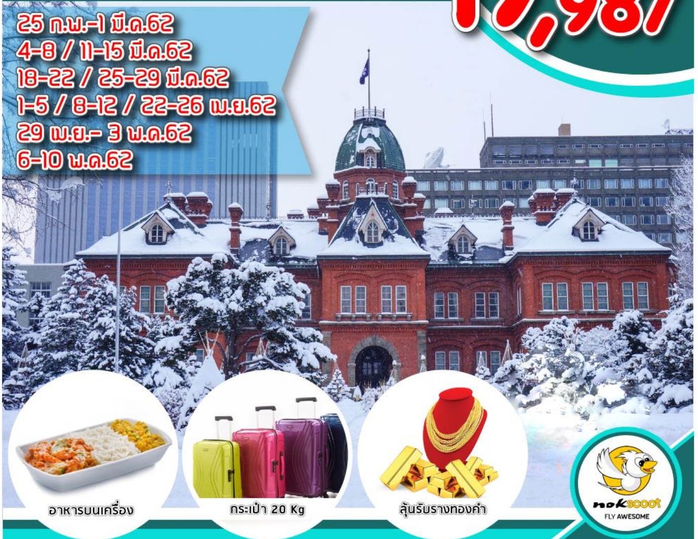
อาหารบนเครื่อง

25 ก.พ.-1 มี.ค.62 4-8 / 11-15 มี.ค.62 18-22 / 25-29 มี.ค.62 1-5 / 8-12 / 22-26 พ.ย.62 29 พ.ย.- 3 ธ.ค.62 6-10 ธ.ค.62