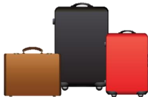
น้ำหนักกระเป๋า 20 กิโลกรัมต่อ

** เนื่องจากเป็นตัวกรุ๊ป จึงไม่สามารถเลือกรับประทานอาหารได้ **