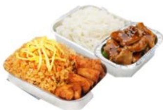
บริการอาหารร้อน ไป-กลับ บนเครื่อง

** เนื่องจากเป็นตัวกรุ๊ป จึงไม่สามารถเลือกรับประทานอาหารได้ **